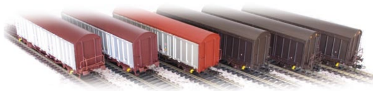
H-vagnar från hobby trade .